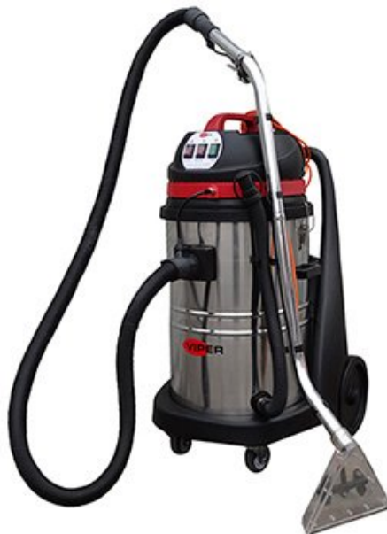
A kép illusztrációként szolgál.

A CAR275 piszkosvíz tartály kapacitása 75 liter, a tisztítószeres víztartályé 28 liter, ezek egymás felett helyezkednek el. Két motorral és leeresztő csővel szerelt, ezért könnyen üríthető a piszkosvíz tartály, a nélkül, hogy a motorrészt leemeljék. Az első bolygókerék és a hátsó nagy kerekek által könnyen manőverezhető. A gép alapfelszerelése a felszívó fej és gégecső, használatra kész.